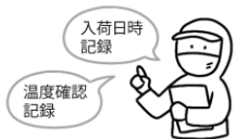
納入業者・食材の品質管理

子どもたちに安全な給食を提供するために、国のガイドラインに沿った衛生管理を行っています。各工程で、決められた内容を実施し、記録しながら作業を行うことで安全性を高めています。