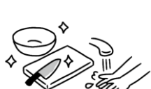
調理室での衛生管理